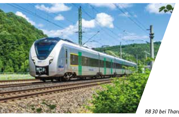
RB 30 bei Tharandt

Wir möchten Ihnen die Nutzung des öffentlichen Verkehrs so einfach wie möglich gestalten und verbessern die Anschlüsse zwischen Bus und Bahn, sorgen für ein einheitliches Tarifsystem, verständliche Informationen und kundenfreundlichen Service.