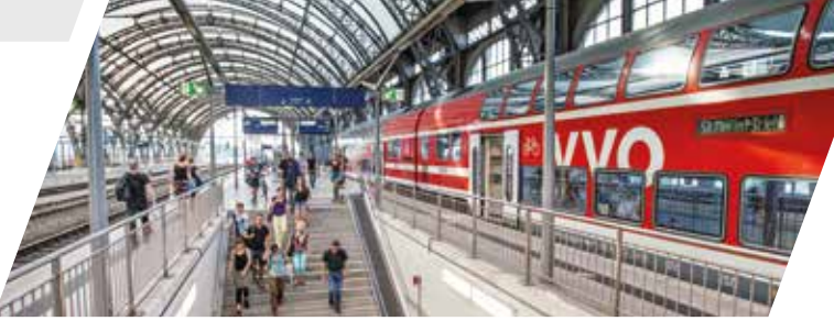
S-Bahn im Dresdner Hauptbahnhof

Weitere Informationen erhalten Sie bei den jeweiligen Bahngesellschaften sowie den InfoHotlines der Verkehrsverbände.