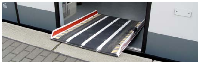
Angelegte Rampe zwischen Bahnsteig und Fahrzeug